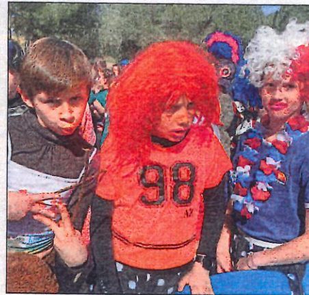
De la créativité chez les jeunes sportifs.