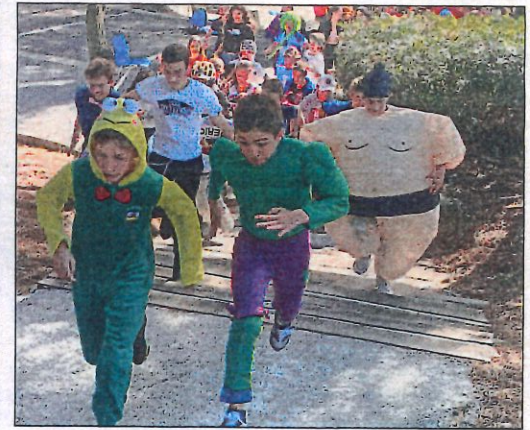
C'est parti pour 45 mn de course.