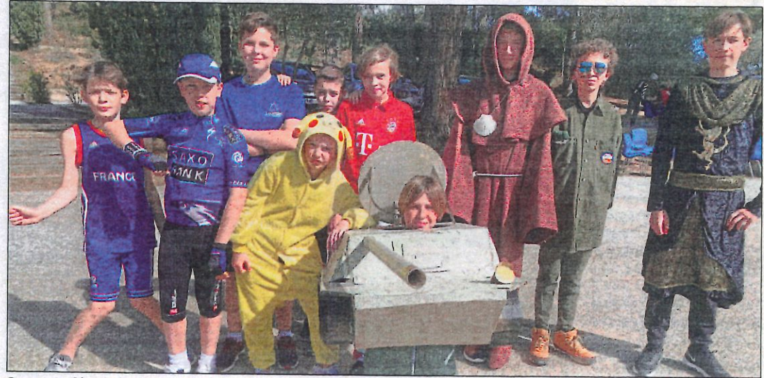
Souvent déguisés, les élèves ont fait preuve d'une très grande imagination.